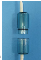
Рис. Б. Аромакапсула диффузора

Диффузор может использоваться для кислородной ароматерапии. Для этого в его устройстве предусмотрена специальная разборная аромакапсула (см. рисунок Б). При необходимости в нее можно поместить губку, пропитанную ароматической жидкостью. Это поможет сделать процедуру особенно приятной.