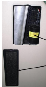
блок с фильтром тонкой очистки

2. Перед включением аппарата, проверьте входные губчатые и фильтры тонкой очистки (на дне и на боковых стенках аппарата), убедитесь в том, что они чистые, в противном случае, очистите их и поставьте обратно.